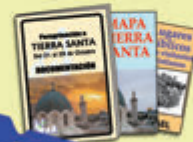
Información completa, etiquetas...