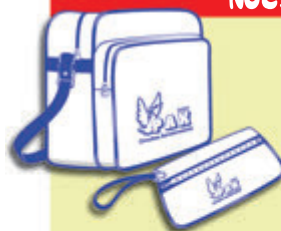
Bolsa y cartera documentación