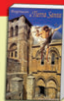
Libro-Guía de Tierra Santa