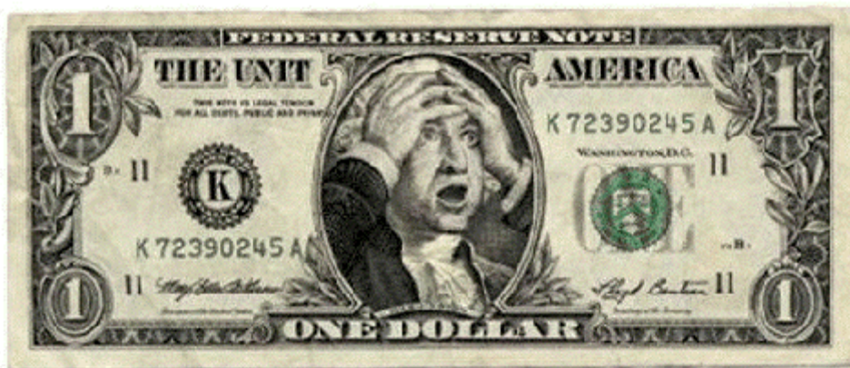
Adam Smith contemplando el capitalismo financiero

Secretariado Diocesano de Pastoral del Trabajo C/Rafael de Riego 16, 3º Izda 28045 – Madrid Telf. 915276661 @: depastra@gmail.com Web: http://dpt.archimadrid.es