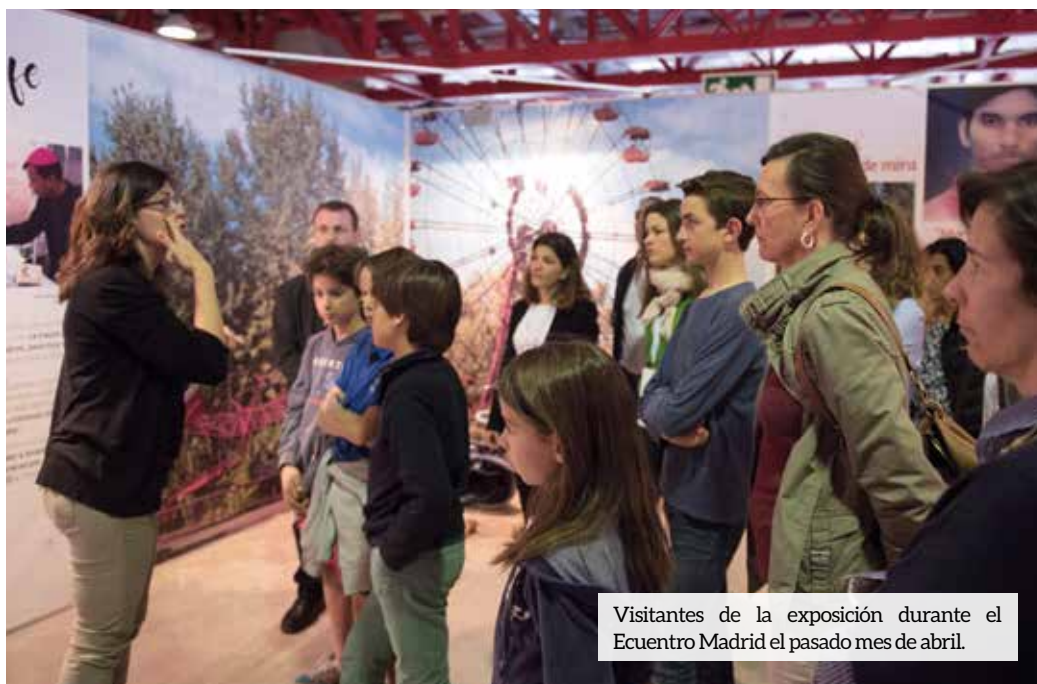
Visitantes de la exposición durante el Encuentro Madrid el pasado mes de abril.

También la exposición “Rostros de la Misericordia” estuvo en Barcelona y Asturias (Oviedo, Gijón y Avilés). Esta muestra pone de relieve a tantos religiosos que desde Ayuda a la Iglesia Necesitada se apoyan para que puedan hacer obras de misericordia con los más necesitados.