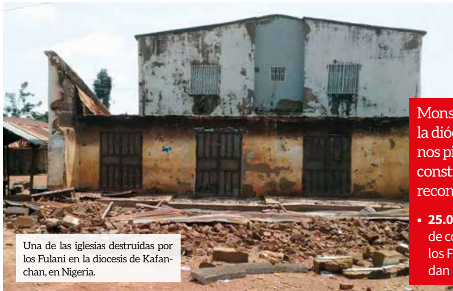
Una de las iglesias destruidas por los Fulani en la diócesis de Kafanchan, en Nigeria.